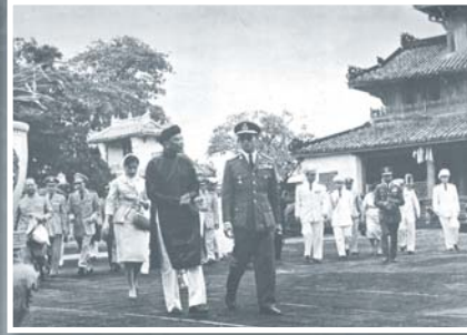
ในภาพทั้งสองพระองค์ ประธานาธิบดี โง ดินห์ เดียมและมาดาม โง ดินห์ นูห์ ประทับและยืนอยู่หน้าทำเนียบประธานาธิบดีในไซ่งอน ทอดพระเนตรและชมพิธีเชิญธงชาติไทยและเวียดนามขึ้นสู่ยอดเสา

หลังจากนั้นได้เสด็จฯ ไปยังทำเนียบประธานาธิบดี ณ ที่นั้น มีการถวายพระสุธารสจिन หรือน้ำชาจีน ในการนี้พระองค์ได้พระราชทานเครื่องเขียนถมตะทอง (ชนิดของเครื่องถม คล้ายกับเครื่องถมทองแต่หาได้ยากกว่า) ให้แก่ประธานาธิบดี พร้อมทั้ง สมเด็จพระนางเจ้าสิริกิติ์ พระบรมราชินีนาถ ก็ได้พระราชทานของที่ระลึกให้แก่นางโง ดินห์ นูห์ เป็นผ้าไหมไทยอย่างดี